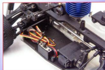
▲《NT18T》的電子機件架設方式是在底盤與電子機件之間隔了一片樹脂製的固定板，可減緩震動，確保機件壽命。