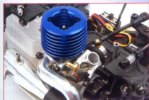
▲標準配備的引擎為0.8級，排氣量0.8CC，據研判應為TKT製品，穩定、易啟動的口碑令人信心加倍。