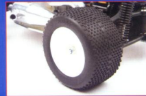
▲XRAY專為《NT18T》量身打造的越野型輪胎，四方型的短釘配合較厚的胎壁設計，達到理想的抓地性與吸震性。