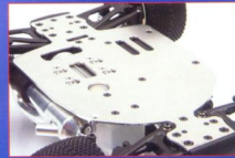
▲和大多數引擎越野車一樣，《NT18T》也是採用平板式底盤，材質為瑞士製造的7075 T6鋁合金，剛性無庸置疑。