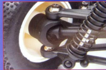
▲前後輪共計4支傳動軸均採用十字萬向節的款式，具有相當大的運動角度。傳動軸主體採用特殊塑料製成，質輕、韌性高。