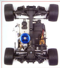
▲《NT18T》可說是麻雀雖小五臟俱全，整體的機件架設雖然在有限的空間，卻能井然有序的予以排列。