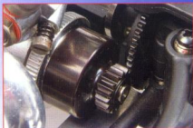
▲原車配備的離合器罩齒，以及銜接的大直齒均為耐久性極佳的鋼製品；出廠設定的齒輪比即可達到時速50km以上。