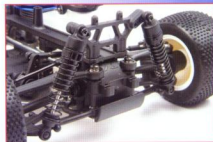
▲全車配備4支超輕量塑料避震器，雖然外觀不甚起眼，但內部造工相當精細，因而獲得十分良好的油壓效果。