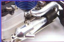
▲專為0.8級引擎所設計的加速管，採用銦合金加工製造，具有提升性能並且增進散熱的效果。