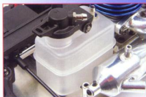
▲標準配備的油箱，容量為30cc，對應0.8級引擎能有理想的行駛時間。油箱內部亦設有過濾石結構，避免油路產生氣泡。