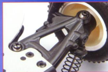
▲懸吊系統採用四輪獨立上下A臂的型式，長行程化的設計確保越野性能的實現，內外側均以球頭固定，調整空間極為寬廣。