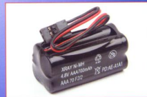
▲《NT18T》是採用套件方式發售，必須自行組裝；附電子機件的版本除了有限精迷你同服機，還附上了小體積的罐體電池。